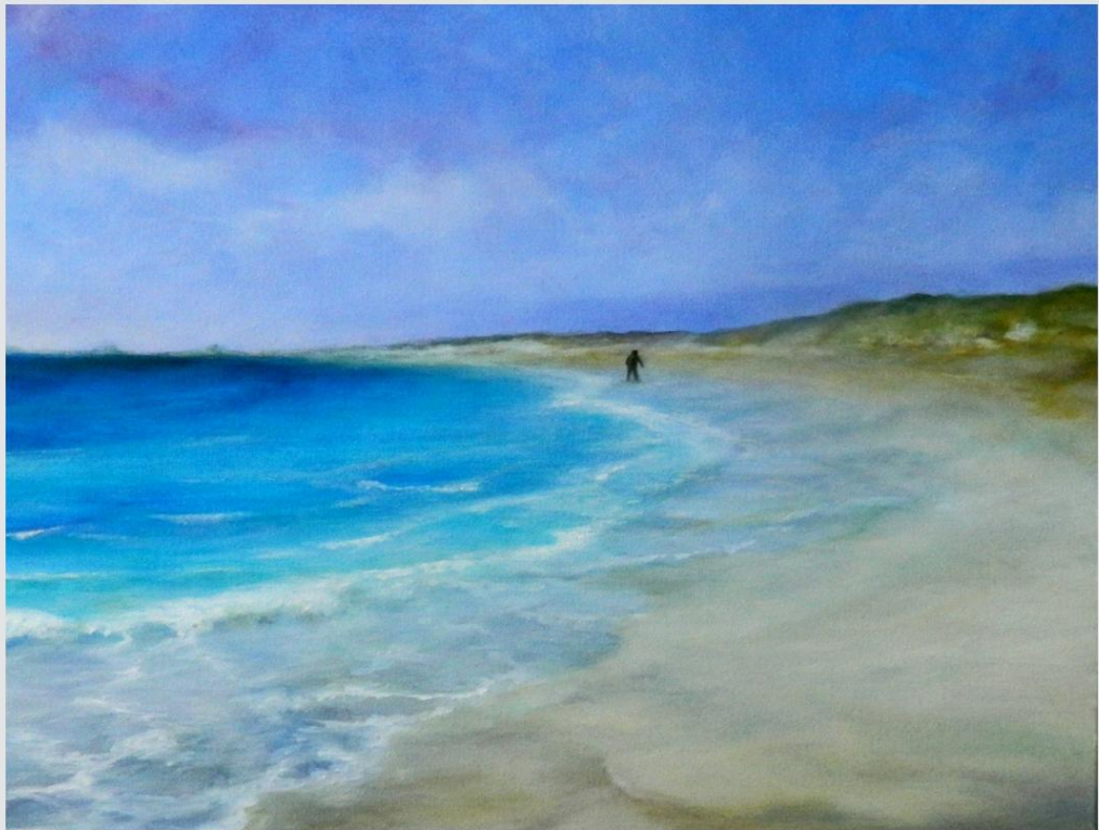
olio su tela