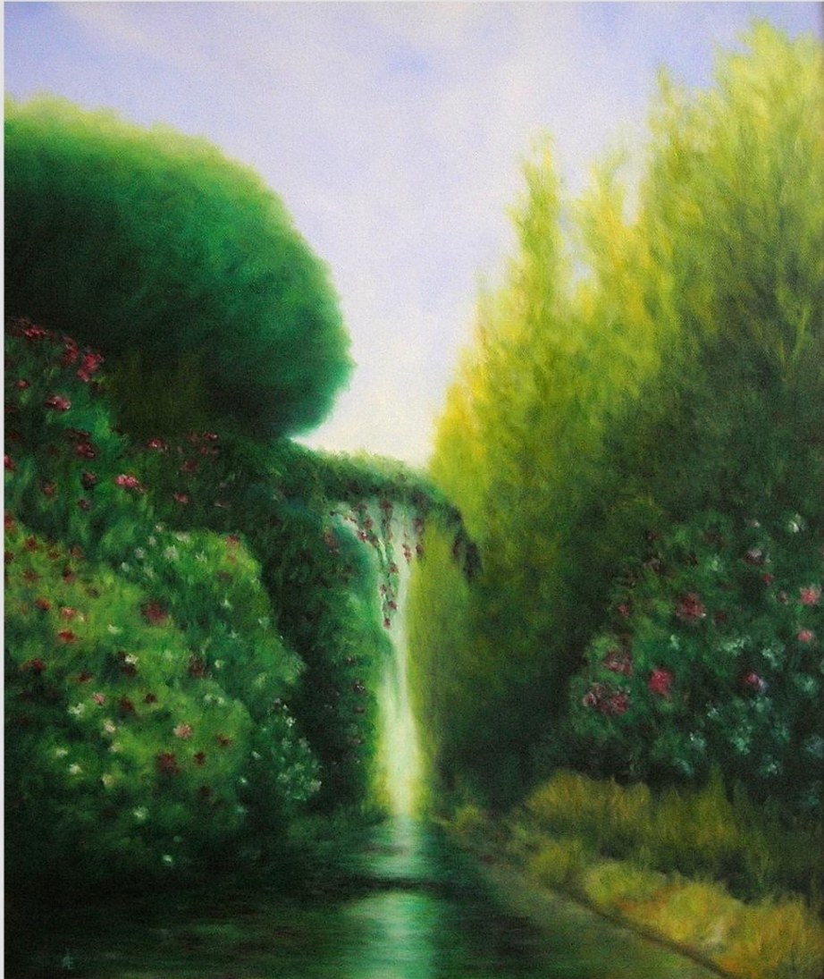
"Il Canale" O