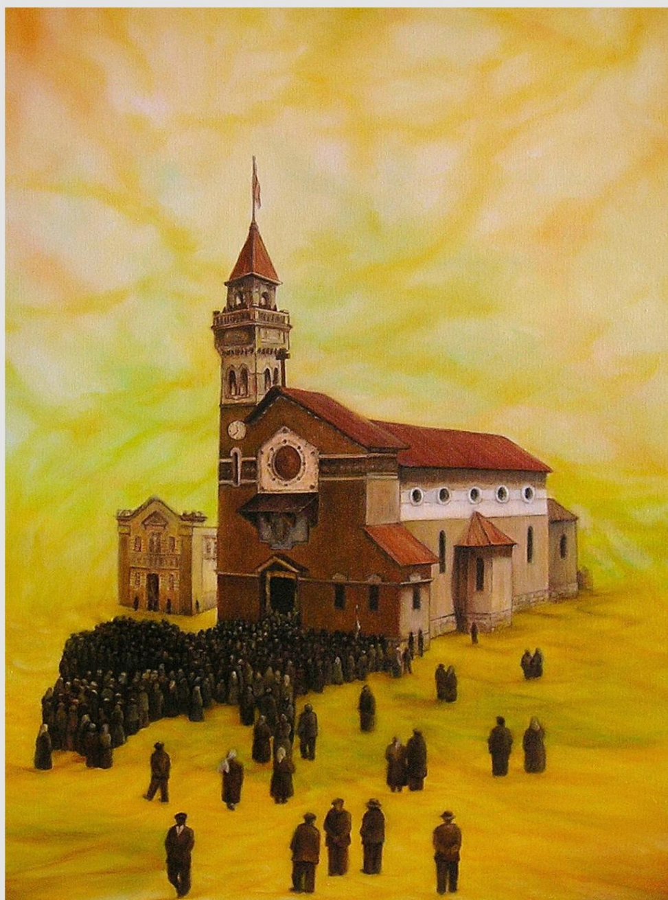
"Arborea - Nascita di una comunità Olio su tela