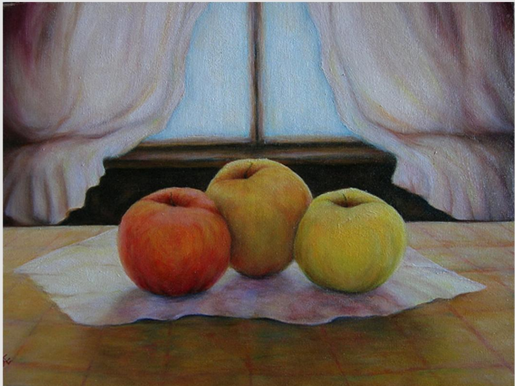
"Le tre mele" Olio su tela