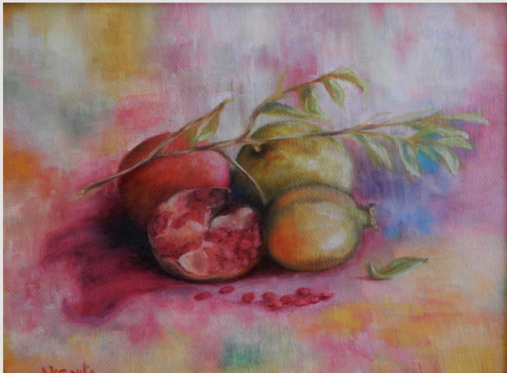
Olio su tela di Juta "Melagrane"

Anno 2008 - XXXX Premio Primavera - Mostra Nazionale di Pittura e Bianco e Nero; Premio "Rivista d'Arte e Cultura l'Arpi 74" – Foggia