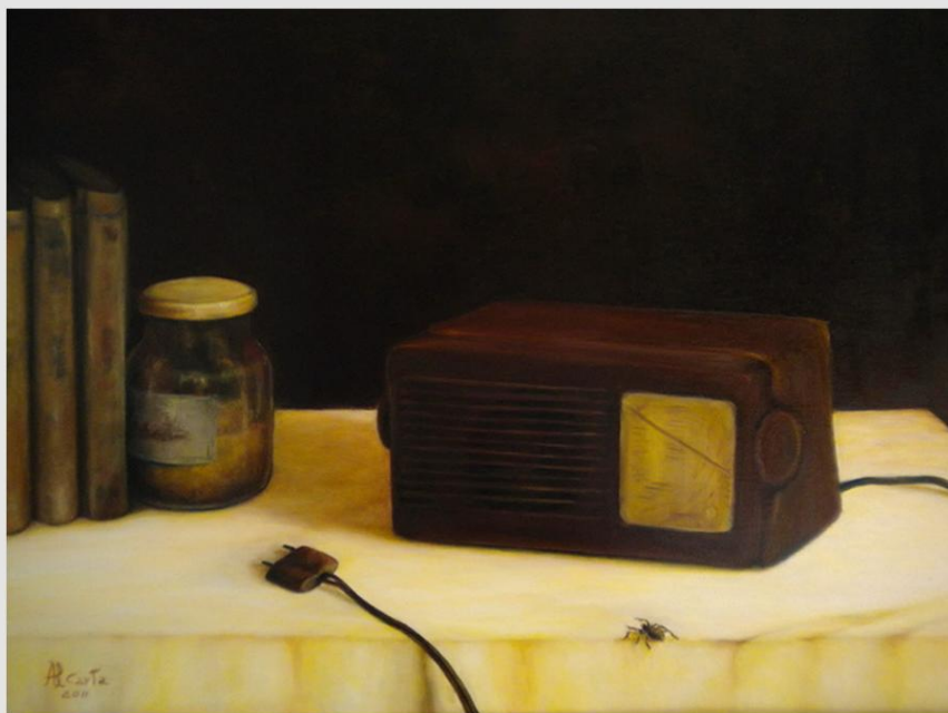
"Suoni invisibili" Olio su legno