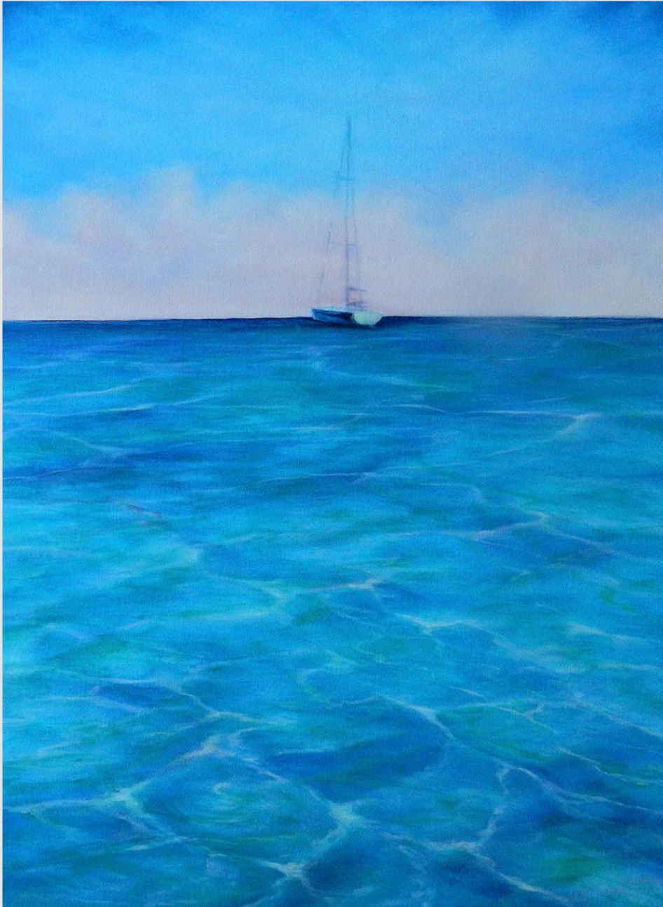
olio su tela