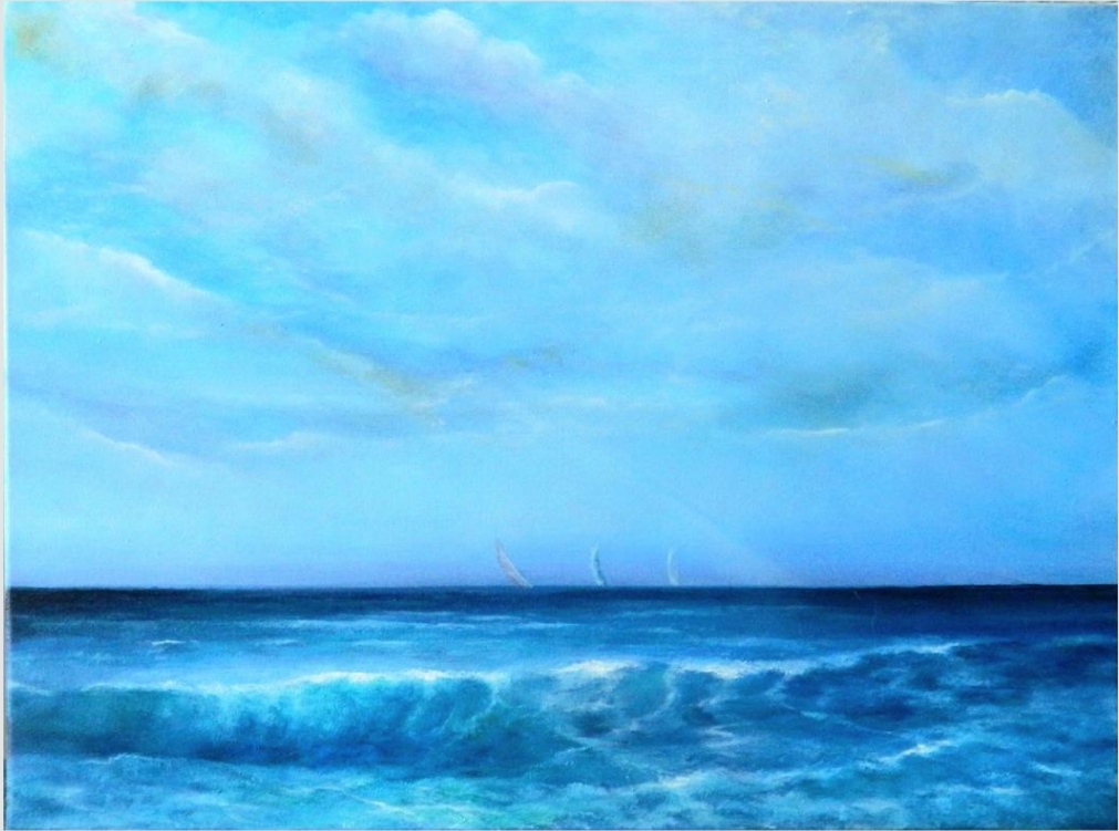
olio su tela