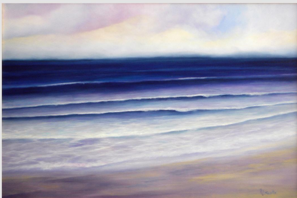
"L'immensa solitudine del mare" Olio su tela