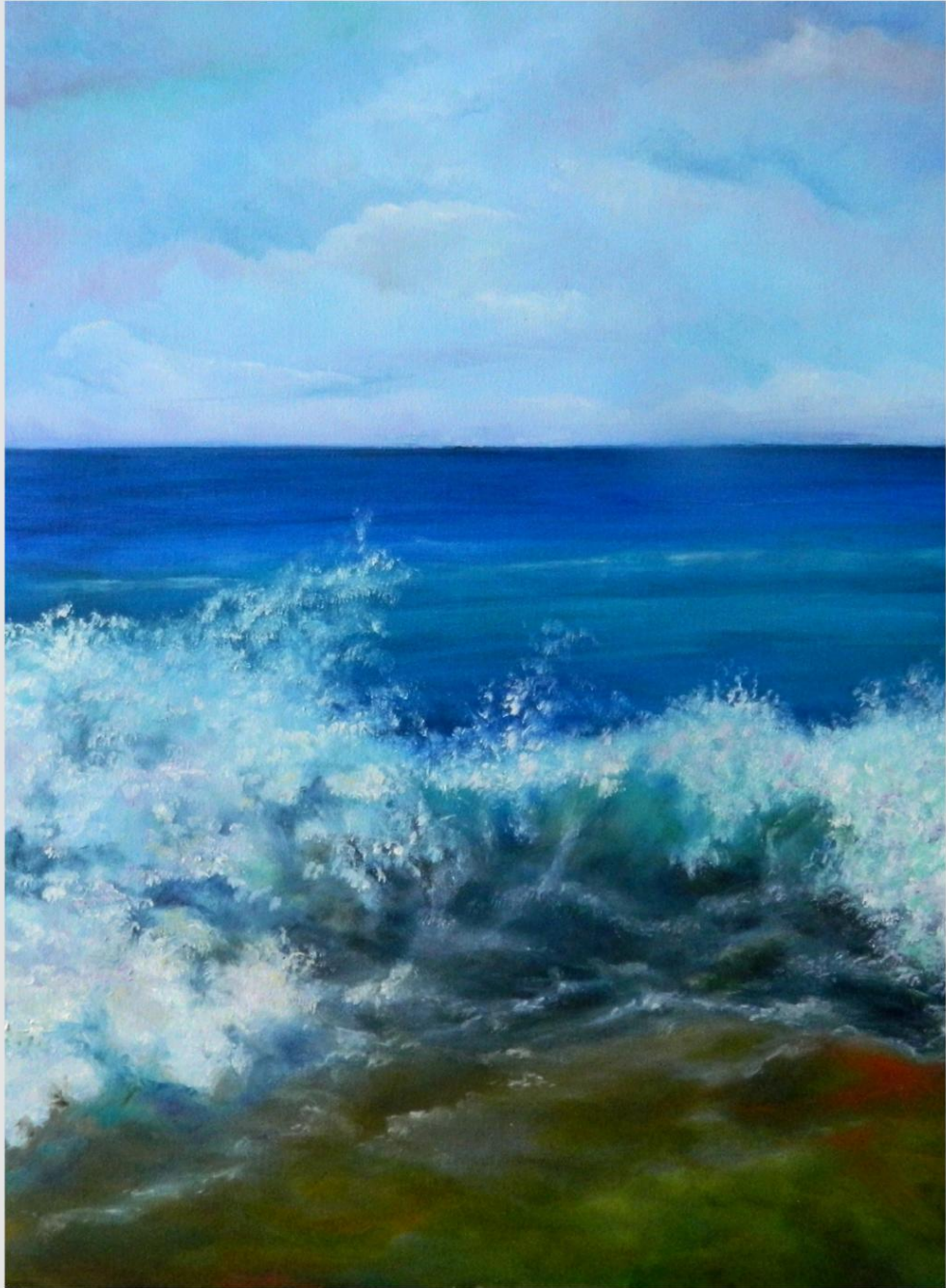
olio su tela