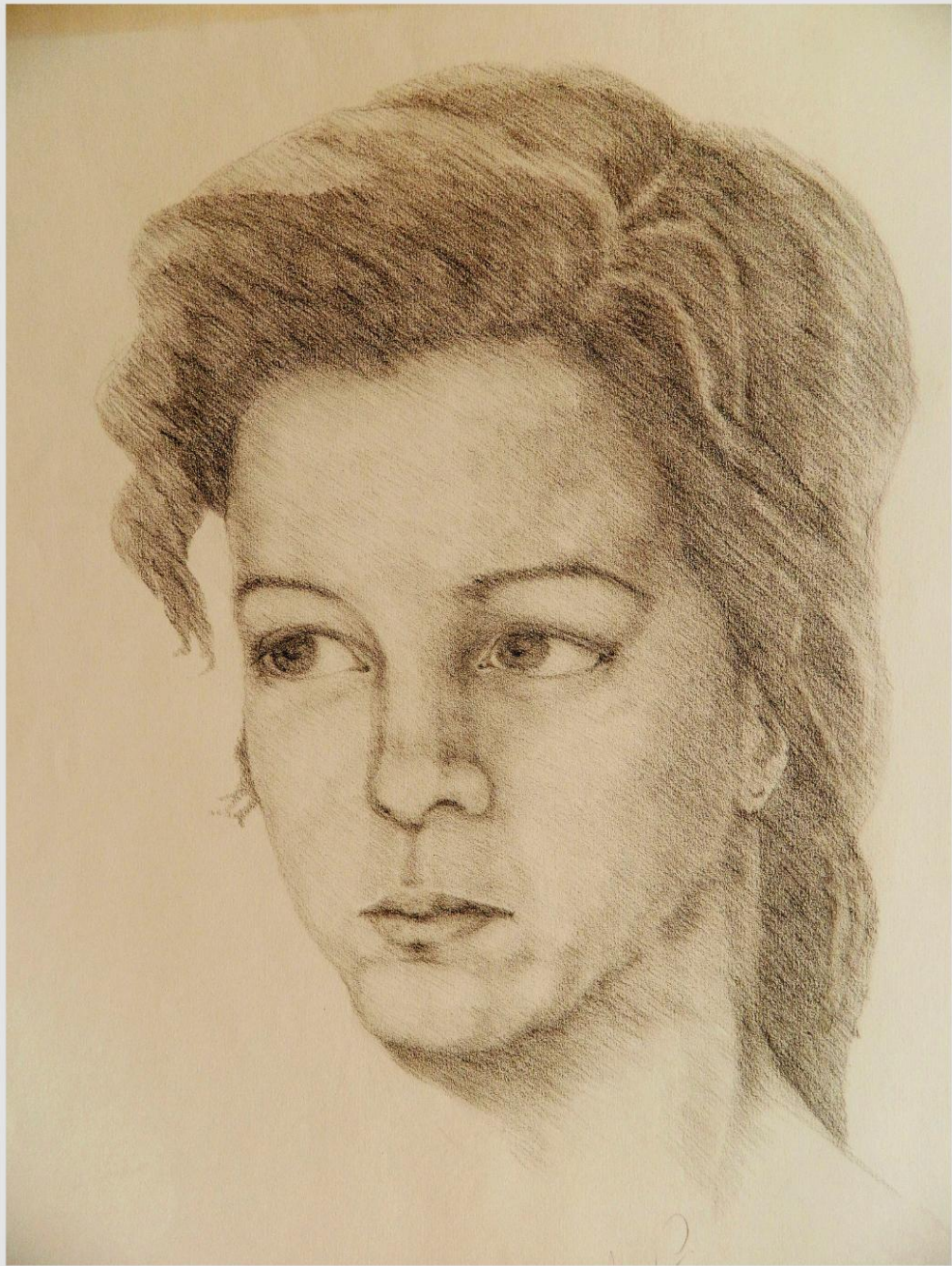
Ritratto di giovane ragazza Matita carbone su carta canson