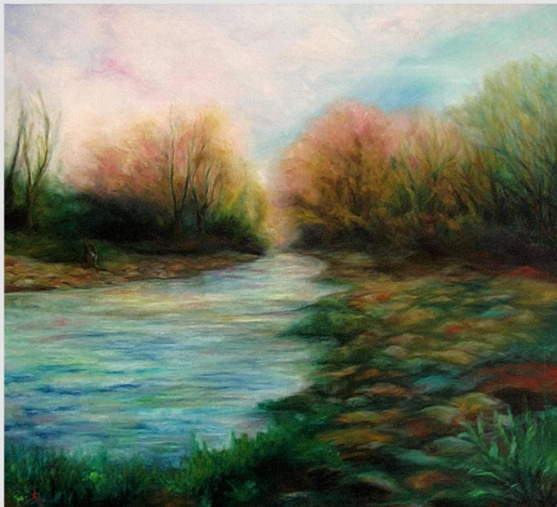
"Paesaggio di campagna" Olio su tela