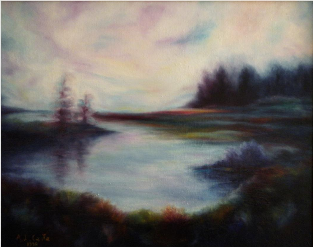
"Lo Stagno" Olio su tela