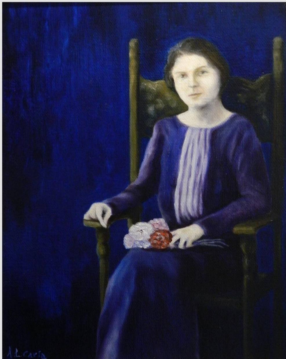
Olio su tela di Juta "Ritratto di Maria"

Anno 2002 - 6° Concorso Internazionale di Pittura Contemporanea "Arte Donna 2002" 3° Premio con assegnazione della medaglia bronzea