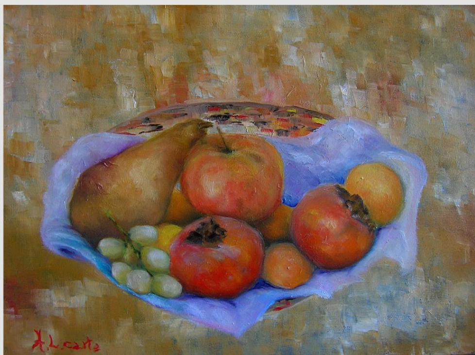
Olio su tela "Il Cesto di Frutta"

Anno 1998 - 3° Concorso Nazionale di Pittura Contemporanea "Colori d'Italia" - Sassari Gran Premio della Stampa