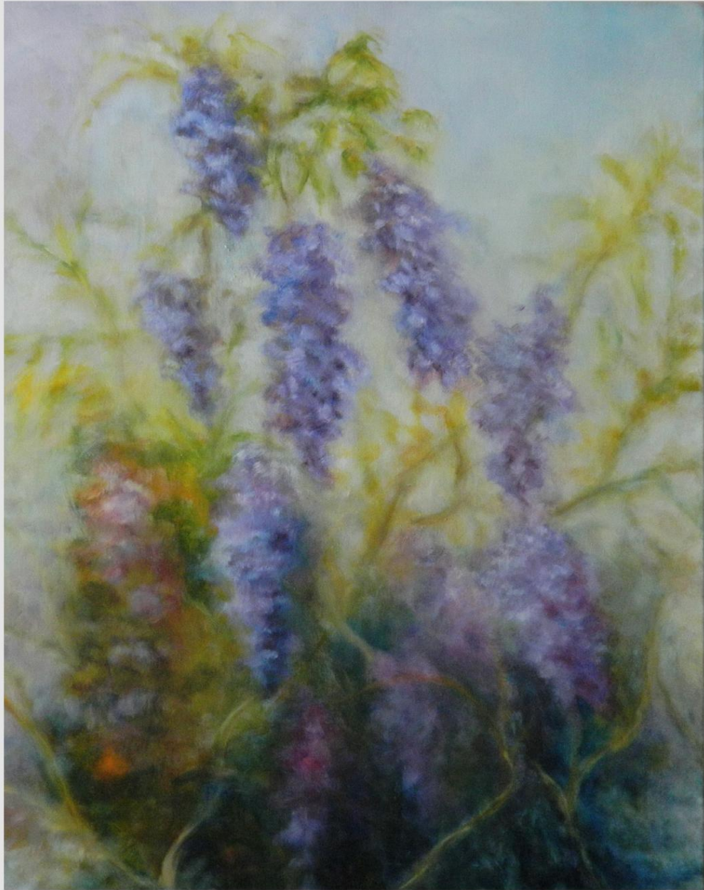
"I glicini in fiore"